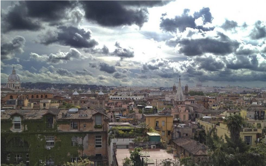
"Brilla la città"